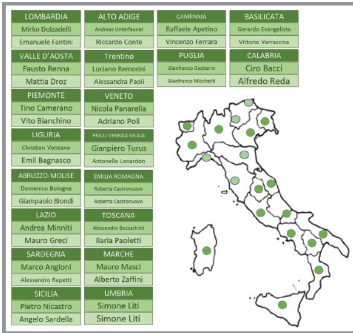
Schema con Regione, Segretario Generale Regionale, Referente Regionale Green